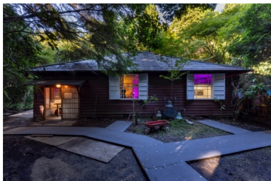
「Sunny Day Light / Haru to Teru」