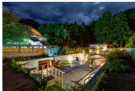
「Peach Beach, Summer School」2019