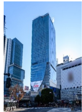
▲渋谷スクランブルスクエア外観

名 称： 渋谷スクランブルスクエア／SHIBUYA SCRAMBLE SQUARE 事業主体： 東急(株)、東日本旅客鉄道(株)、東京地下鉄(株) 所 在： 東京都渋谷区渋谷2丁目24番12号 用 途： 事務所、店舗、展望施設、駐車場など 延床面積： 第Ⅰ期（東棟）約181,000㎡、第Ⅱ期（中央棟・西棟）約96,000㎡ 階 数： 第Ⅰ期（東棟）地上47階 地下7階、 第Ⅱ期（中央棟）地上10階 地下2階、（西棟）地上13階 地下5階 高 さ： 第Ⅰ期（東棟）229.7m、第Ⅱ期（中央棟）約61m、（西棟）約76m 設 計 者： 渋谷駅周辺整備計画共同企業体 ※(株)日建設計、(株)東急設計コンサルタント、(株)JR東日本建築設計、 メトロ開発(株) アーキテクト： (株)日建設計、(株)隈研吾建築都市設計事務所、(有)SANAA 事務所 運営会社： 渋谷スクランブルスクエア(株) ※東急(株)、東日本旅客鉄道(株)、東京地下鉄(株)の3社共同出資 開 業： 第Ⅰ期（東棟）2019年11月1日 第Ⅱ期（中央棟・西棟）2027年度 U R L： https://www.shibuya-scramble-square.com